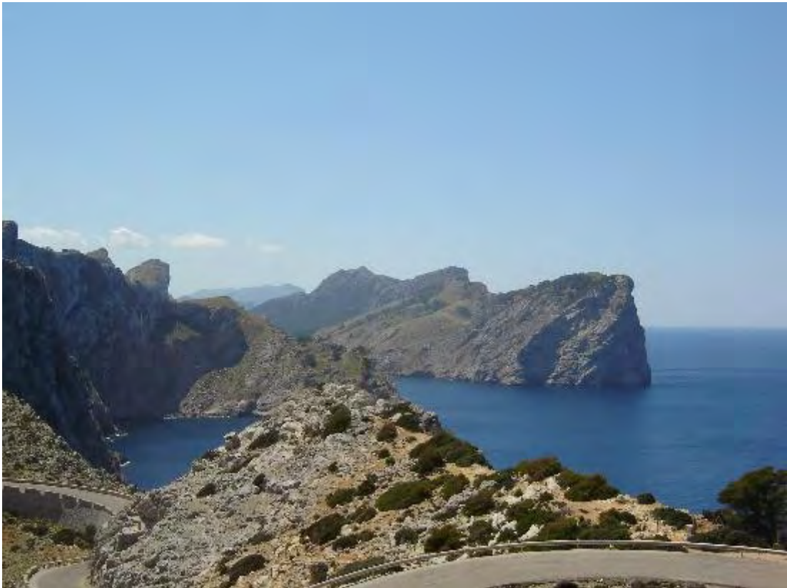
Montagnes au Nord

Jeudi 12 Novembre : Une traversée des montagnes de Majorque – Visite de Deya (Deià) et Valldemossa